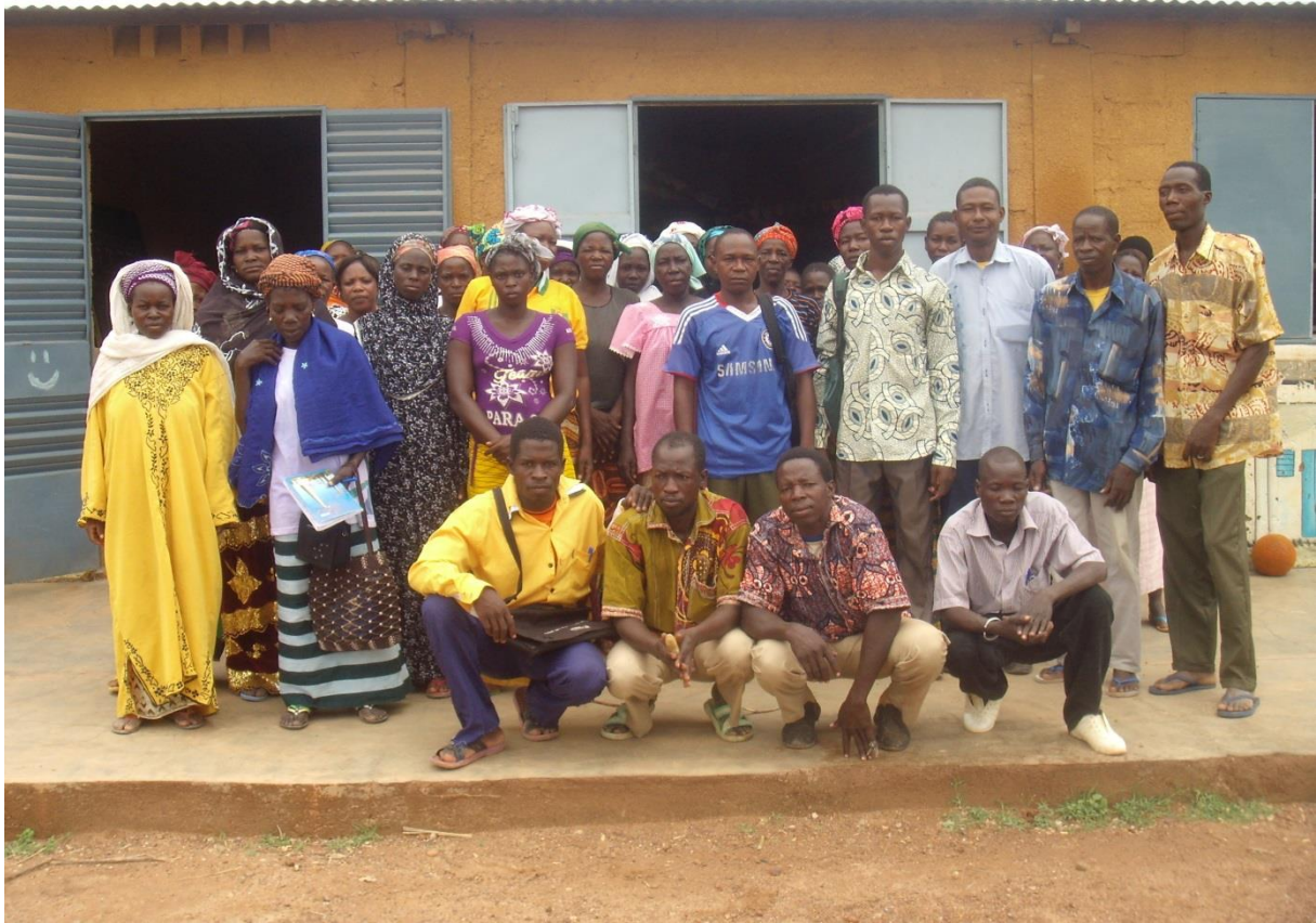
Formation en technique agricole sur les nouvelles semences améliorées avec les délégations des groupements villageois.

Ainsi, l'année 2013 a une fois de plus été marquée par l'apport de réponses aux préoccupations des communautés de Songpèlé dans les différents secteurs du développement. Les réponses apportées ont porté essentiellement sur :