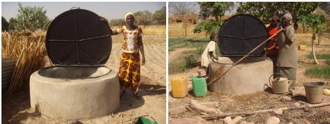
Une vue de la construction de puits sécurisé avec des couvercles