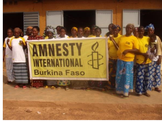
Formation de vingt 20 conseillères municipales de Komki Ipala et Tanghin Dassouri