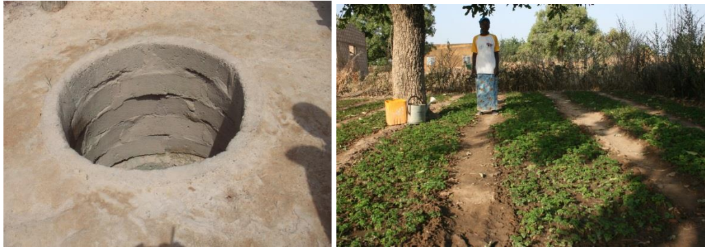
Puits et production de persil

Des revenus substantiels ont été créés pour les ménages.