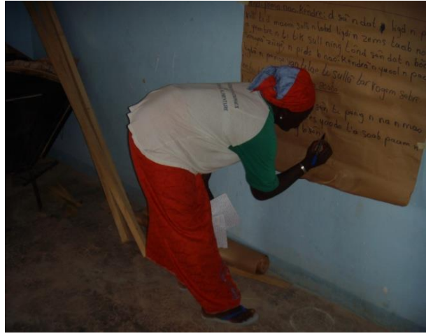
Formation des femmes bénéficiaires