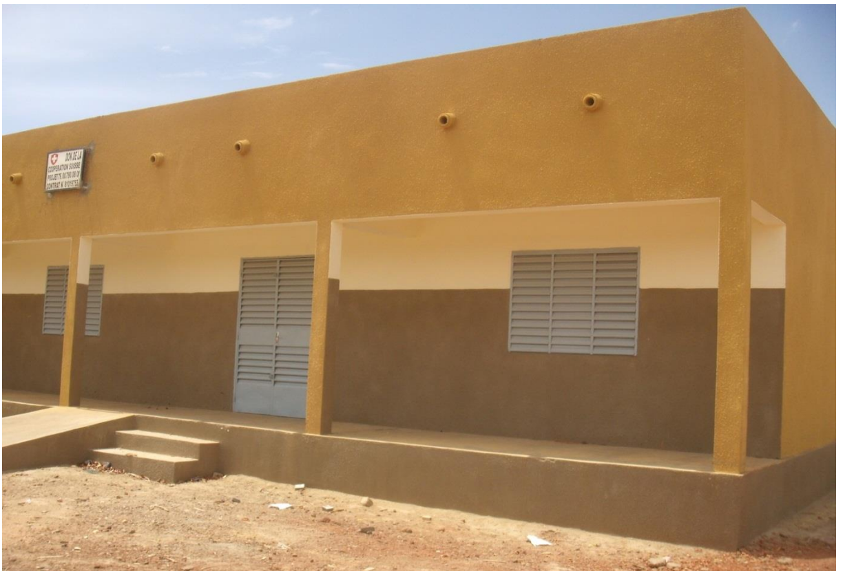
Une vue des deux salles de classe réalisées par la DDC