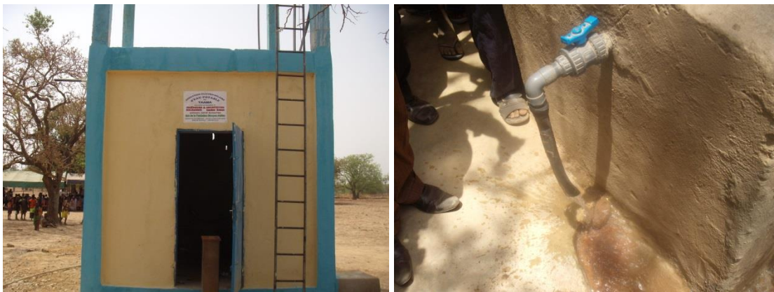
Inauguration du château de Tama et La première venue de l'eau dans la borne fontaine

Au cours de ce forum, l'ASFUD a été félicité pour sa bonne gestion de l'eau, à travers le comité du village de Goghin qui a présenté la plus importante recette en matière de gestion de l'eau.