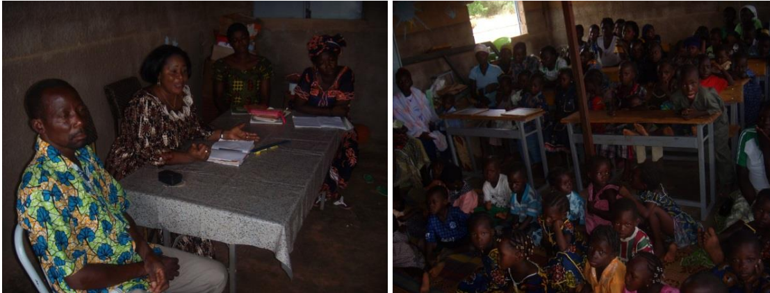
Rencontre et repas communautaire parents enfant parraines et la coordination