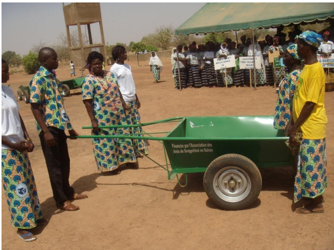
Remise de charrette par Mme la Préfet de Komki-Ipala en compagnie du représentant du Préfet de Tanghin – Dassouri lors de la célébration du 8 mars a Songpèlé

Il est ici indiqué de souligner que le site apicole abritant les ruches a fait l'objet d'un retrait de la part des propriétaires terriens. En effet, outre le besoin exprimé de disposer de leurs terrains, l'arrivée d'un projet de carrière pour le concassage des granites destinés aux projets de bitumage des routes par l'Etat, a récupéré une partie des sites abritant les ruches. Les solutions attendues des partenaires et de l'ONG Nouvelle Planète, interpellée sur la question en tant que partenaire du centre polyvalent sont toujours attendues ; car il est exigé le déplacement des ruches sur des nouveaux sites.