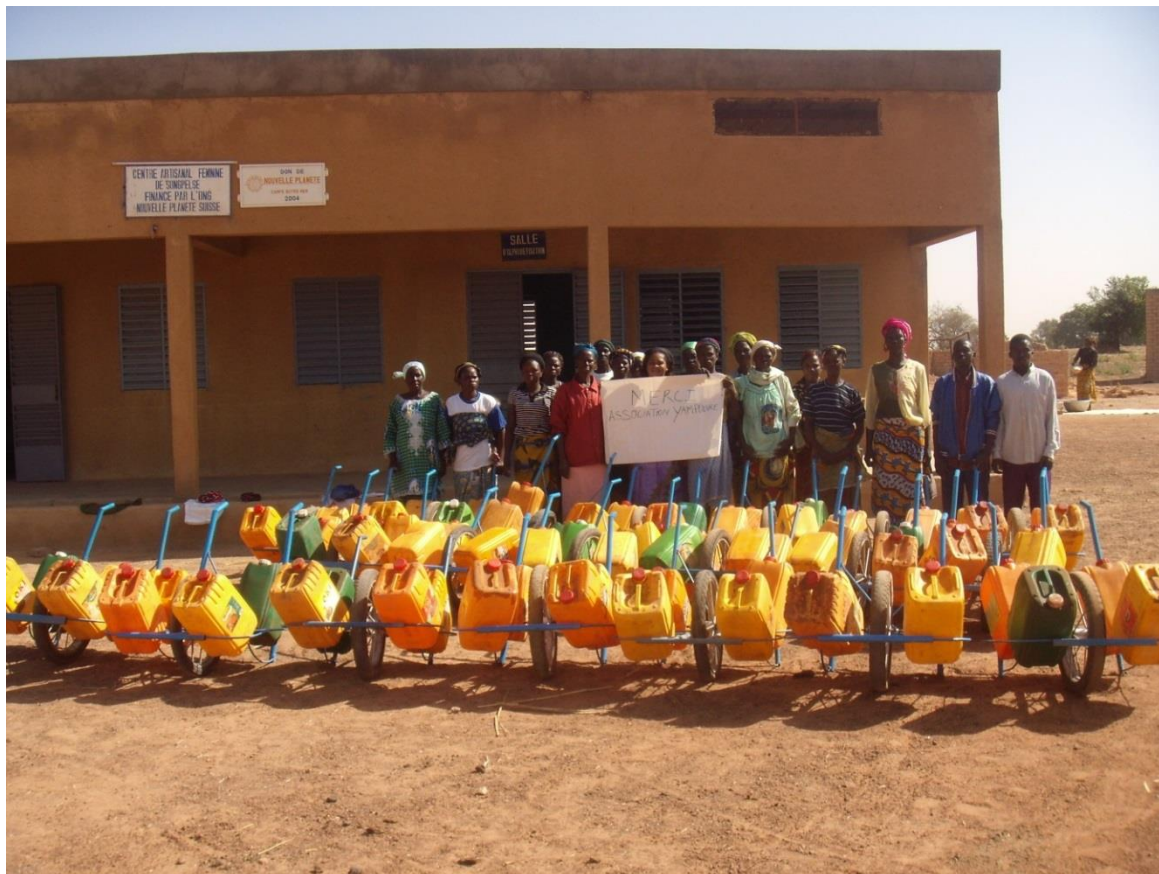
Don des poussettes d'eau aux groupements villageois