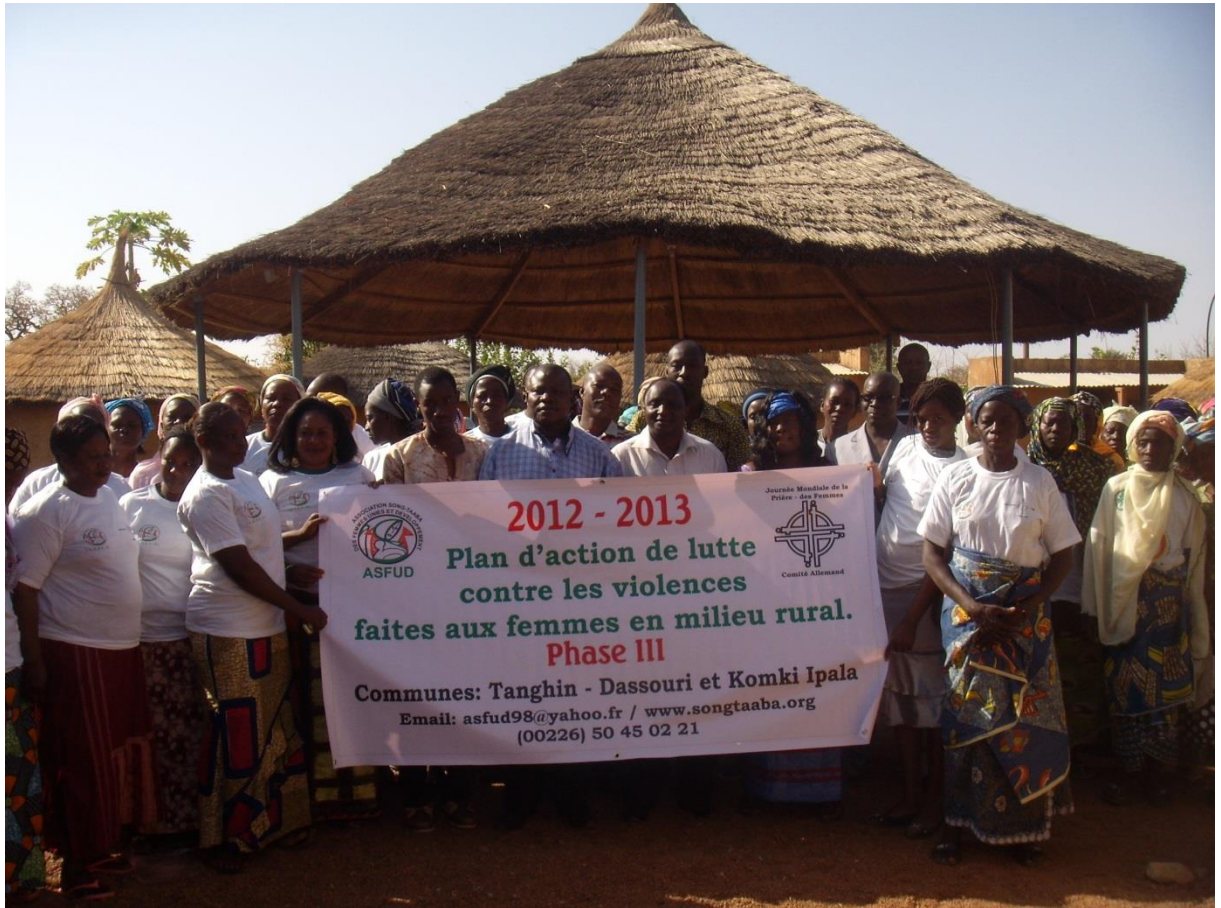
Formation des conseillères municipales de Komki Ipala et Tanghin Dassouri