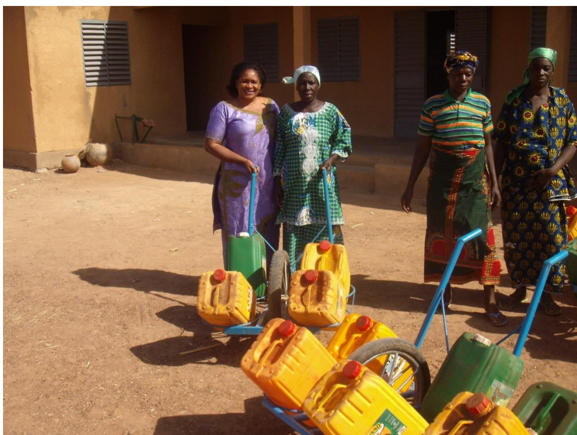
Remise symbolique par la Présidente au groupement villageois de Goghin 2