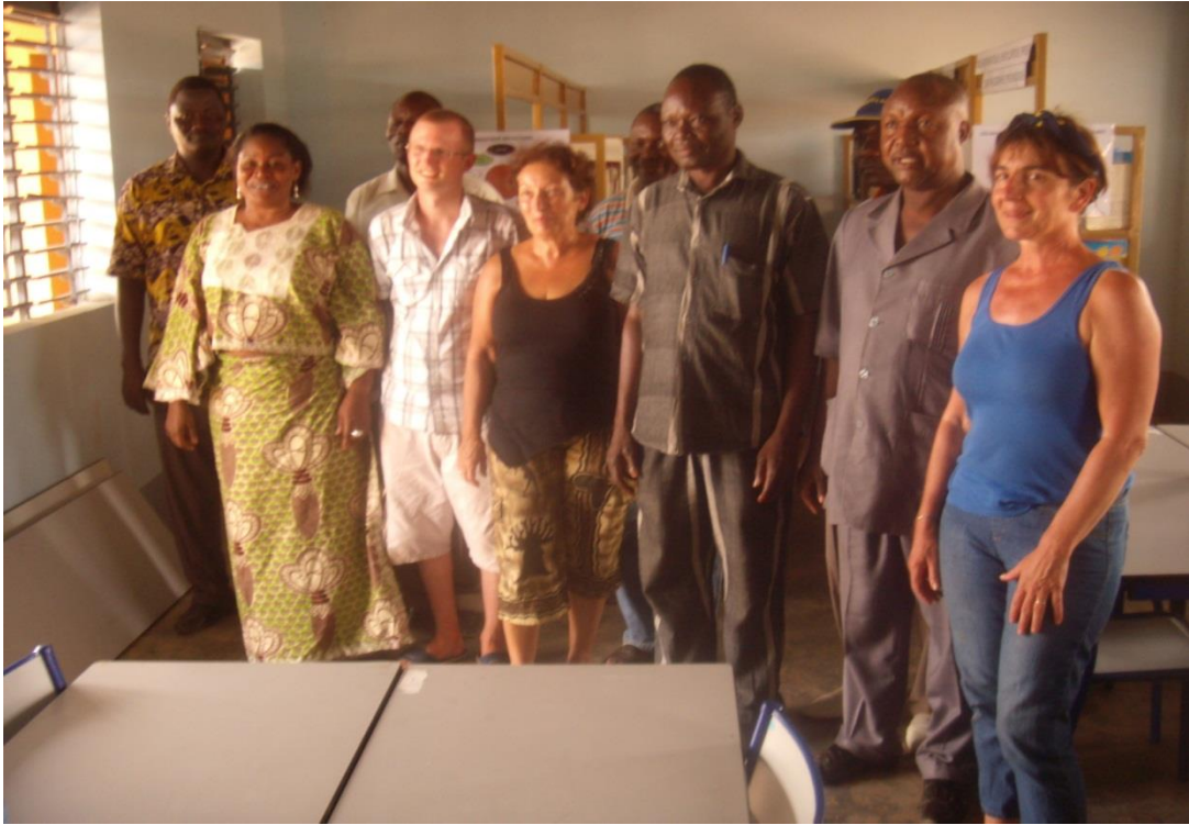
Photo de la visite du représentant de la CEB, du Proviseur du Lycée Départemental de TD, du conseiller pédagogique, de la présidente de l'ASFUD et du représentant des donateurs.