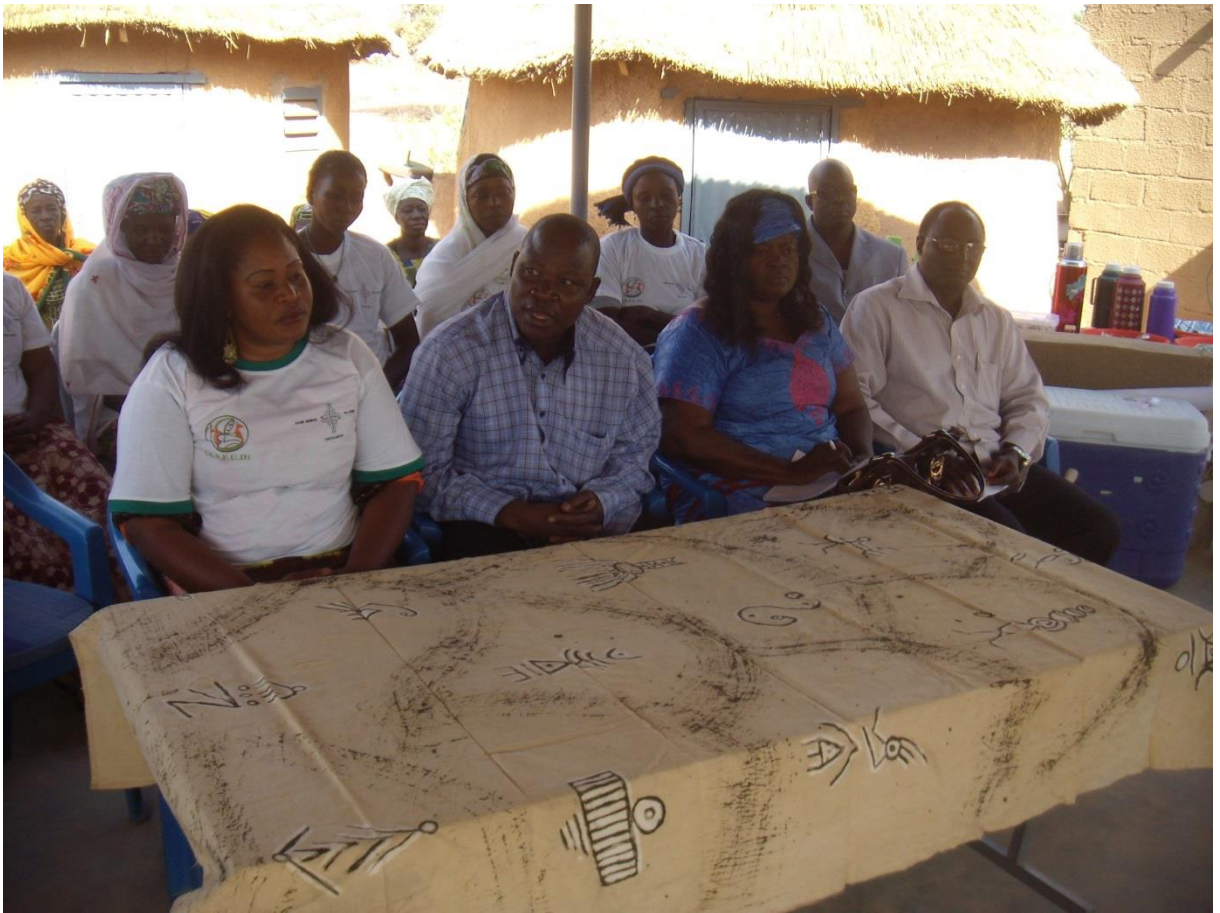
Ceremonie d'ouverture de la formation sous la presidence du prefet de Tanghin Dassouri aupres de la presidede la prefet de Komki Ipala et du Maire de Komki Ipala