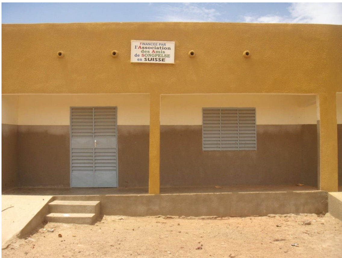
Salle de classe financée par les Amis de Songpèlé en suisse