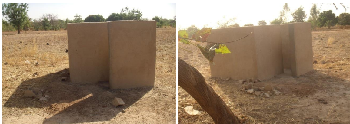
Construction de latrine