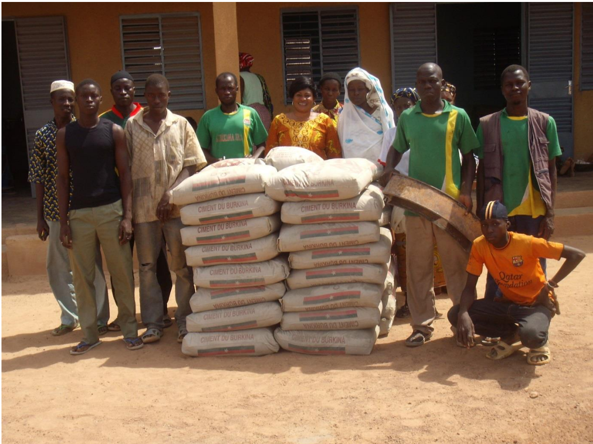
Remise de matériels à la délégation du groupement de Bagma