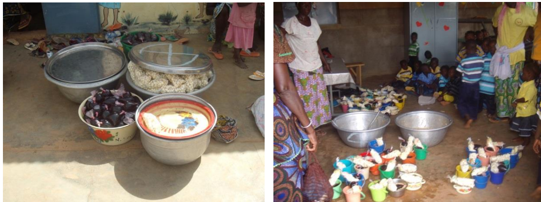
Distribution des repas aux enfants