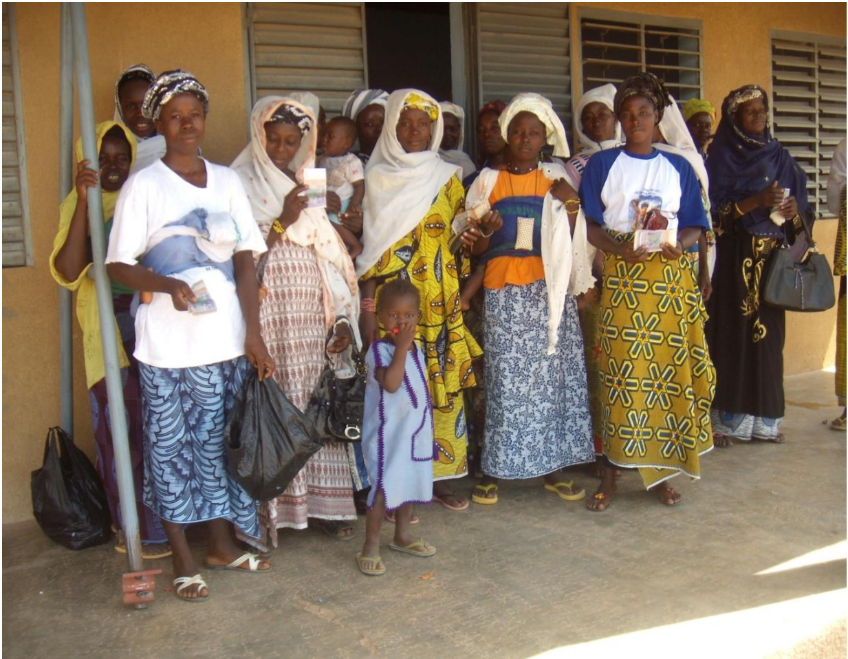
Ceremonie de remise du micro credit de Tama.