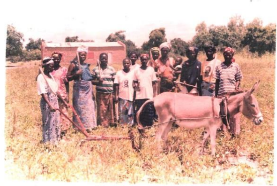
Remise de matériels agricoles groupements de Tama et de Sogué