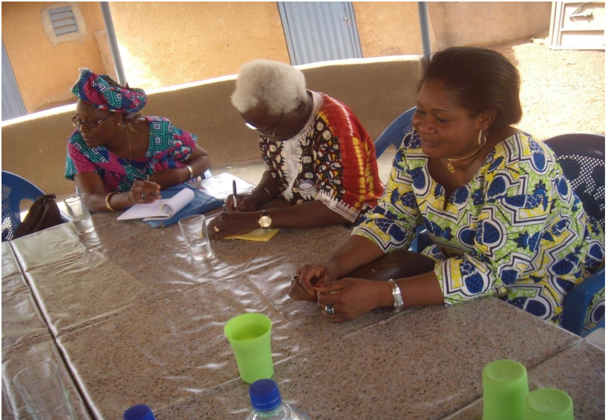
La présidente de l'ASFUD (à droite en compagnie de l'équipe de la mission venue de la DDC

commune de Tanghin Dassouri ont salué la pertinence de la collaboration entre les partenaires Suisse de l'ASFUD et qui est à la base de cette infrastructure scolaire.