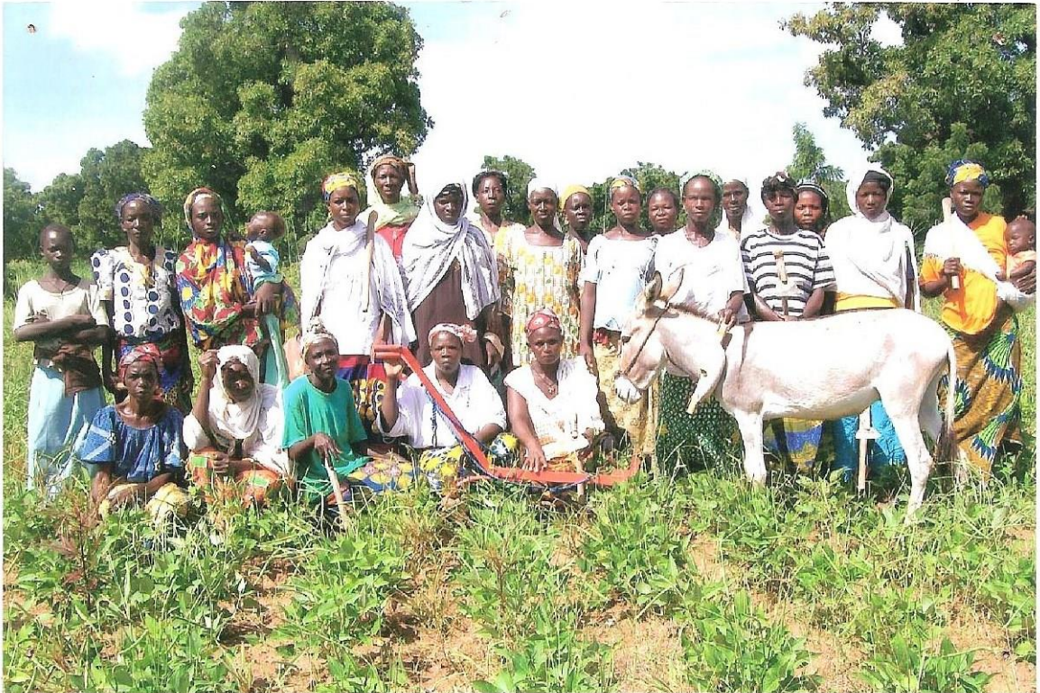
Remise d'âne et charrie au groupement de Taongho